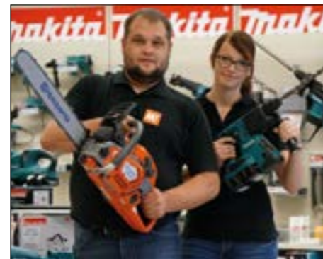
Top-Beratung bei Felbauer.

Wer noch unentschlossen zu Felbauer nach Haag kommt, den erwartet im Geschäft umfassende Betreuung. „Wir gehen ganz bewusst weit über die reine Produk-