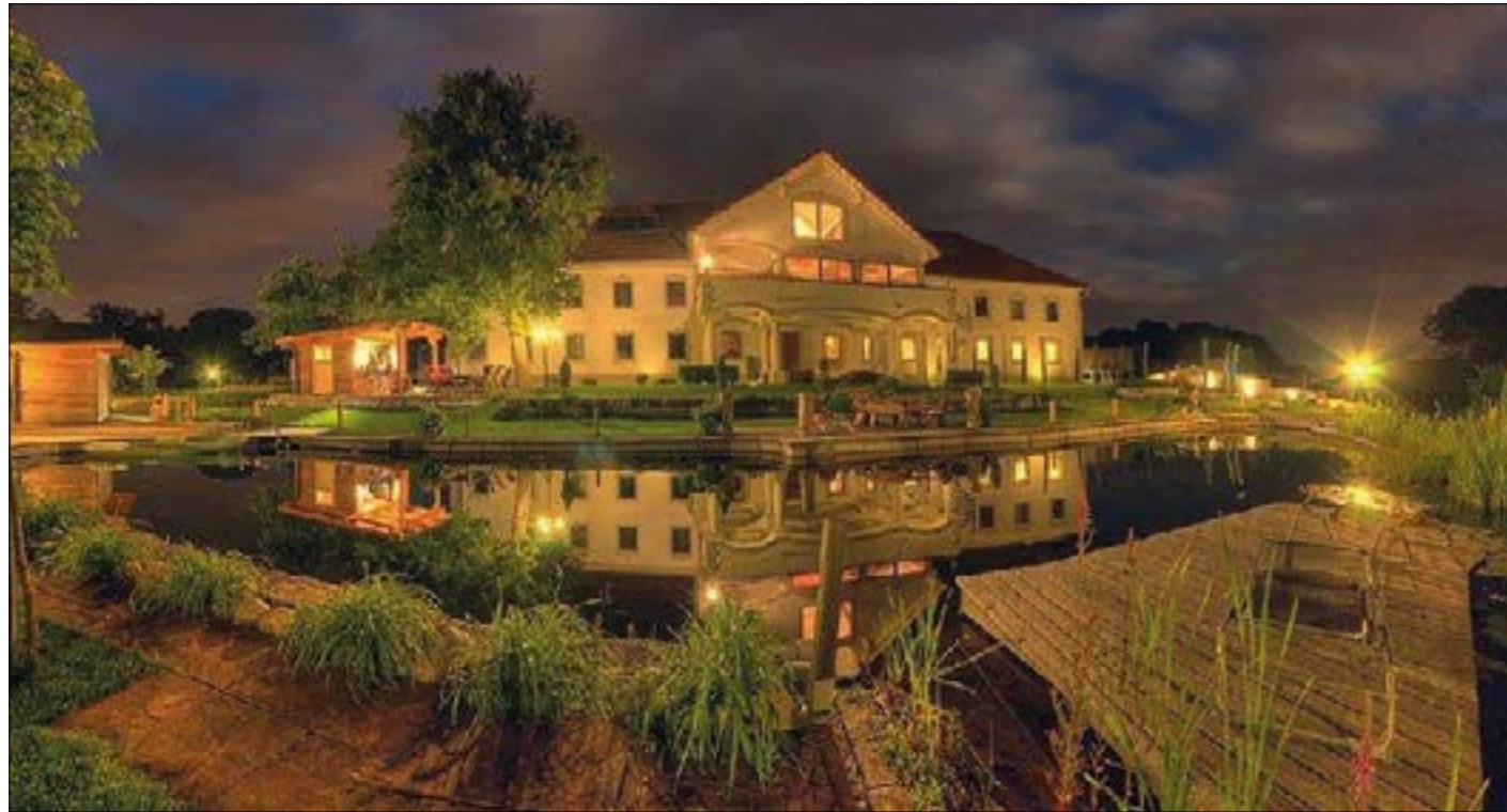
So traumhaft schön kann ein Garten gestaltet werden. Für alle Gartenfreunde sind die Haager Gartentage vom 8. bis 10. April ein Pflichttermin. An den drei Standorten Wiesinger, Felbauer und Offenberger freuen sich die Experten, Garten-Liebhaber beraten zu dürfen.