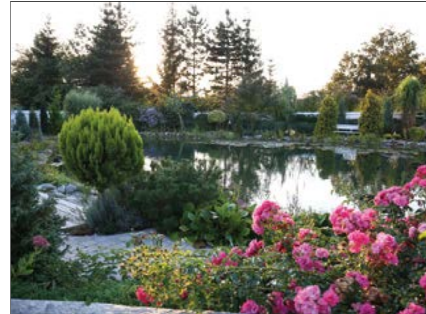
Für alle Gartenfreunde sind die Haager Gartentage im April ein Pflichttermin.

AKTUELLE GARTENTRENDS / Nach zwei Jahren pandemiebedingter Pause melden sich die Haager Gartentage dieses Jahr in bewährter Form und zugleich mit attraktiven Neuerungen zurück.