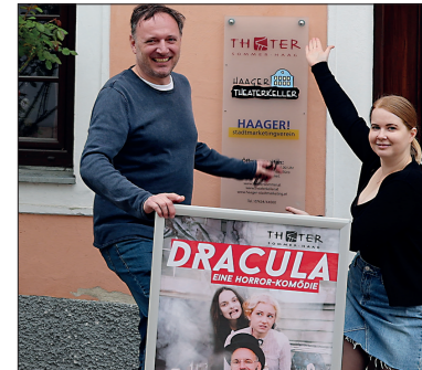
Kultur (Theatersommer und Theaterkeller) sowie das Stadtmarketingbüro sind seit Mitte Jänner in der Höllriglstraße zu finden. Eine positive Symbiose.