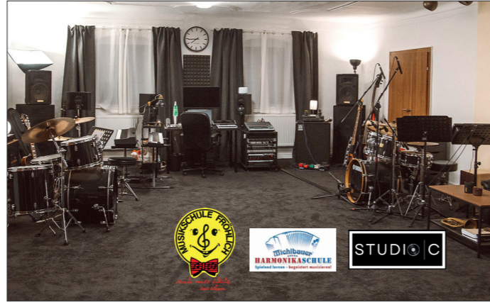
Der coole, neue Probenraum im ersten Stock des ehemaligen Gasthaus Wagner am Hauptplatz lässt keinen Wunsch offen.

Vom Notenständer bis Flipchart, vom Schlagzeug bis Keyboard, von verschiedensten Verstärkern und Boxen bis hin