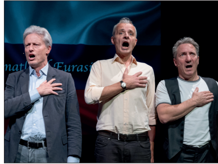
Wir Staatskünstler , „Alte Hunde, neue Tricks“, Sonntag, 7. Juli 2024, 21.00 Uhr.

THEATERSOMMER / Karten für das Rahmenprogramm gibt es unter 07434/44600 bzw. reservierung@theatersommer.at.