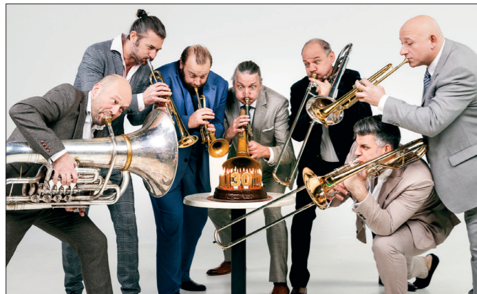
Nur noch wenige Karten sind für Mnozil Brass verfügbar. Der Auftritt mit ihrem Programm „Jubelei - 30 Jahre Mnozil Brass“ ist am Sonntag, 14. Juli 2024, um 20.30 Uhr.