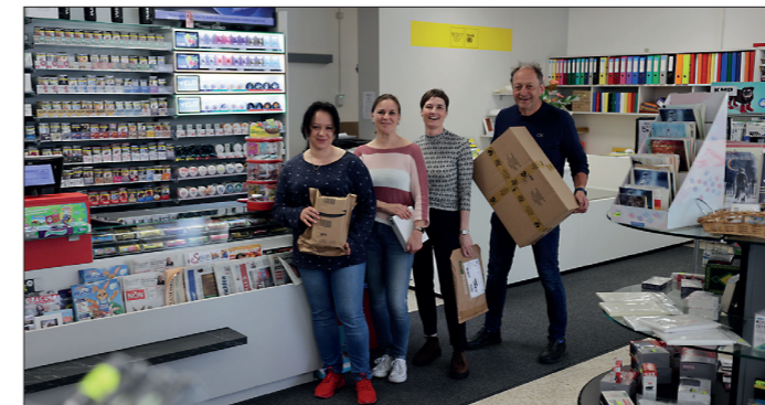
Viel großzügiger und geräumiger ist der Geschäftsraum der Trafik und des Post.Partners Schweinschwaller in der Linzer Straße im Vergleich zum vorigen Lokal.