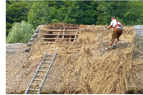
Der Erhalt von und die Wissensweitergabe über traditionelles Kunsthandwerk – wie hier die Arbeit mit Schilf – steht im Mittelpunkt des neuen Vereins.

Des Weiteren ist die Schaffung eines Biotops im Mostviertel geplant, um das Wachstum, die