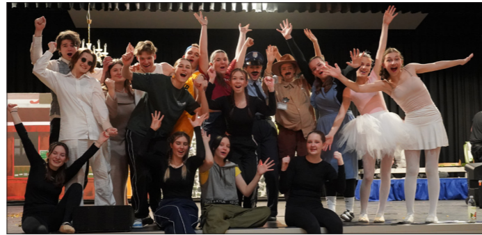
Das gesamte Ensemble des Musiktheaters „BACK ON STAGE“ nach der gelungenen Premiere.

Der Stadtmarketingverein gratuliert auf diesem Wege seinen Mitgliedsbetrieben ganz herzlich.