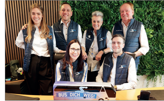
Das Team des Reisebüros Kattner freut sich, ihre Kunden nun mitten am Haager Hauptplatz begrüßen zu dürfen.

Und auch die Trafik und der Post-Partner Schweinschwaller haben sich entschieden, ihren Standort zu wechseln. Sie sind nun in der Linzer Straße 20 zu finden, nur wenige Meter von ihrem alten Standort entfernt.