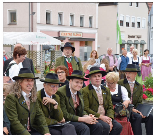
Zahlreiche Vereine (Bild links), wie beispielsweise der Chor Haag (Bild rechts) nutzten die Gelegenheit und waren zu Pfingsten beim Besuch in Pilsting mit dabei. Beim Volksfest werden die Niederbayern nach Haag kommen.