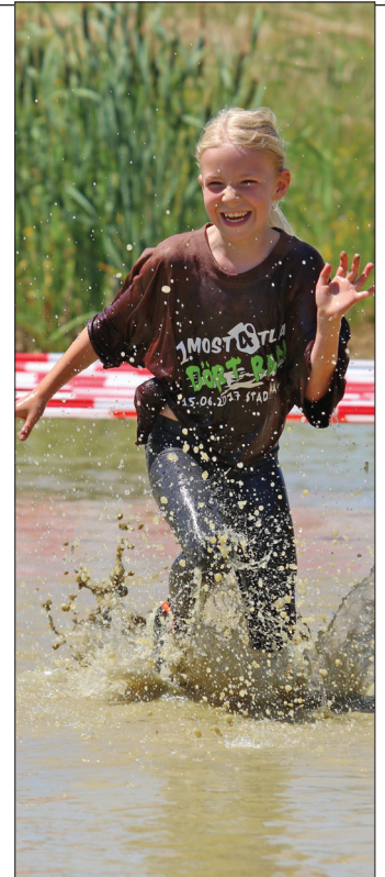
Mit Vollgas durch die Pfütze. Auch die Kinder hatten beim ersten Most4tla DörtRan jede Menge Spaß.