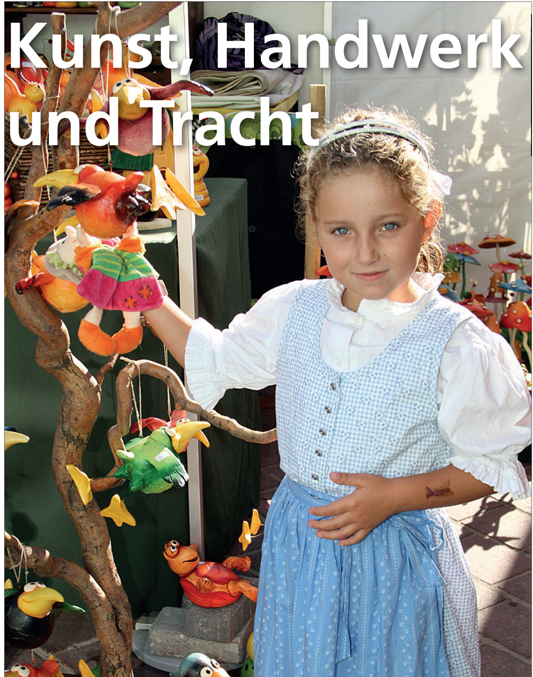
Es ist wieder soweit: Bereits zum vierten Mal findet am Wochenende der Kunsthandwerksmarkt am Haager Hauptplatz statt. Am Sonntag wird beim Dirndlgwand-Sonntag wieder Tracht getragen (S. 4).

Gerhard Stubauer, Bakk. Obmann „Wir Haager!“