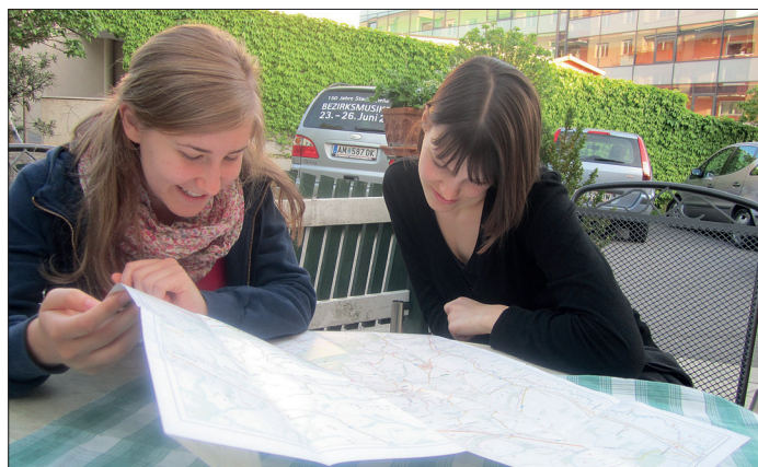
Studierende beim Kartenstudium im Gasthaus Stöffelbauer.

Focus: Wie sind Sie bei den Erhebungen vorge-