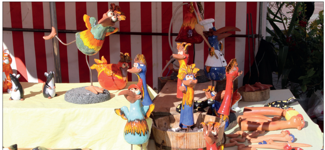
Bunte Figuren, Töpfe, Seifen und noch vieles mehr, sind auch dieses Jahr wieder beim Kunsthandwerksmarkt zu bewundern.