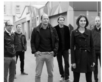
Thekla & the Freewheelin’ interpretieren Songs von Bob Dylan und George Gershwin.

Infos, Reservierungen und Karten unter: www.theaterkeller.at bzw. 07434 / 44600.