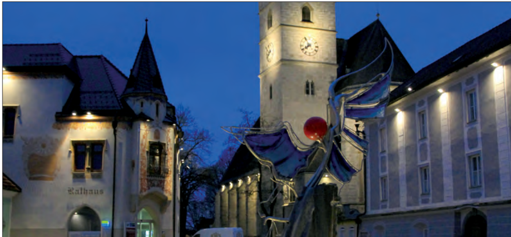
Der Haager Hauptplatz wird heuer endlich wieder Bühne für zahlreiche Attraktionen, musikalische Unterhaltung, regionalen Genuss und tollen Angeboten der heimischen Wirtschaft.

HAAG FEIERT / Nach einer langen Pause wird das Haager Stadtfest heuer wieder veranstaltet (organisiert vom Haager Stadtmarketingverein) und erscheint im Vergleich zu früher in neuem Gewand.