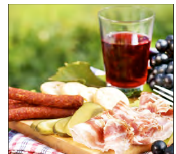
Die regionalen Produkte der Haager Direktvermarkter sind in vieler Hinsicht ein ausgezeichnete Genuss.

JETZT GEORGE ERLEBEN! sparkasse.at/george