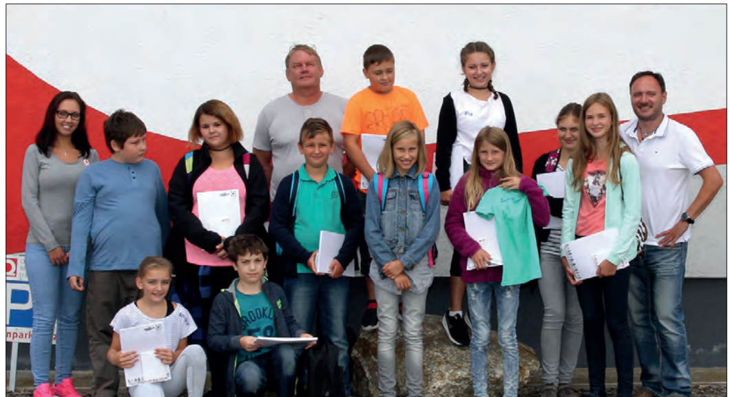
Im Rahmen des Kinderferienprogrammes besuchte der Haager Stadtmarketingverein mit zwölf Kindern die Druckerei Queiser in Wieselburg. Die Kinder lernten dabei alles kennen, was eine Druckerei zu bieten hat. Als Highlight durften die Kids ihren Vornamen aus einer Folie ausschneiden. Mit Hilfe der Queiser-Mitarbeiter wurden diese schließlich auf ein Leibchen aufgedruckt. Anschließend gab es noch ein leckeres Eis. Sicher unterwegs war die Truppe mit einem Bus vom Reisebüro Kattner.