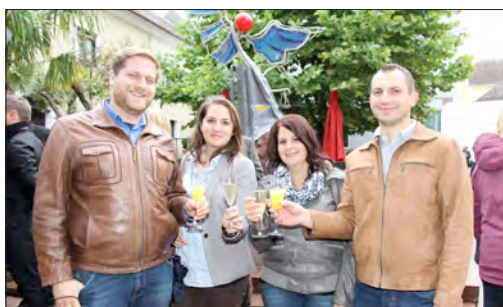
Beim Stand der „Freunde des Haager Theatersommers“ stießen die SKF-Besucher auf den Theatersommer an.