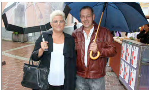
Trotz ein paar Regentropfen war die Stimmung an dem SKF-Abend sehr gut.