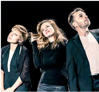
Sprachwitz meets musikalischen Spaß - die „Such-Maschinen“ lassen kein Auge trocken.