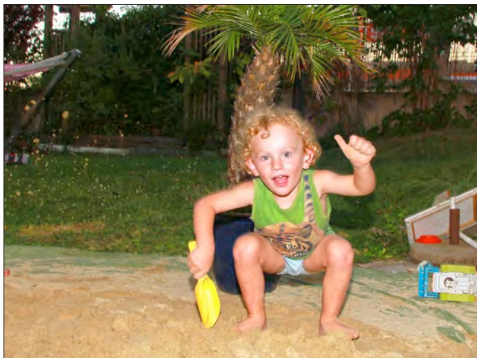
Palmen, Sand und vergrabene Schätze – heuer wird das Urlaubsfeeling mit den Shopping-Days, der Schatzsuche und der AltWeiberSommer-BeachParty direkt auf den Haager Hauptplatz geholt.