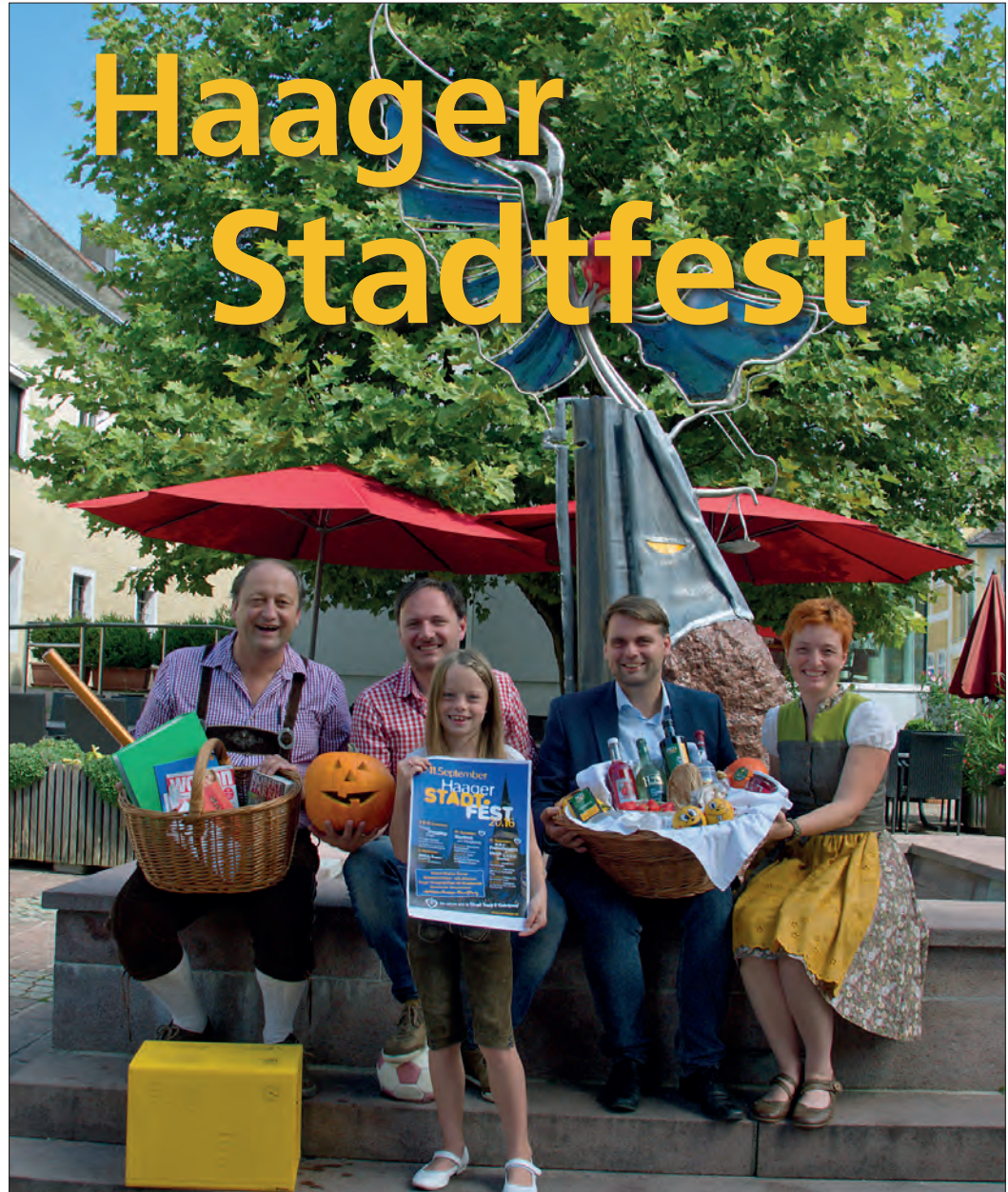
Das Haager Stadtfest von 9. bis 11. September wartet mit zahlreichen Attraktionen auf: Riesen-Wuzzler-Turnier, Schatzsuche, AltWeiberSommer-BeachParty, ein tolles Kinderprogramm, Frühschoppen am Sonntag u.v.m. Dazu präsentieren sich die Haager Geschäfte mit den Shopping Days und die Haager Direktvermarkter bieten kulinarische Genüsse aus der Region am Schmankerlmarkt.