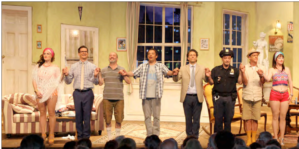
Über einen großen Applaus nach insgesamt 21 Vorstellungen durften sich die Schauspieler des Stücks „Ein seltsames Paar“ freuen.