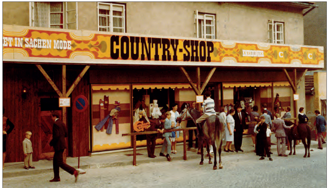
Wie es sich für einen Mode-Kenner gehört, ließ Bruno Kneidinger kaum einen Trend aus: 1971 wurde das Modefachgeschäft zu einem lässigen Country-Shop umgebaut.