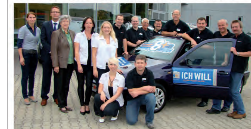
Das Senker-Team wünscht Ihnen eine ruhige und besinnliche Adventzeit!

Sie fahren einen Volkswagen? – Gut! Sie fahren einen Volkswagen, der 8 Jahre oder älter ist? – Noch besser! Nutzen Sie die Dienstleistungen unserer Markenwerkstatt in Kombination mit hochwertigen und günstigen Qualitäts-Ersatzteilen, die perfekt auf Ihr Fahrzeug abgestimmt sind.