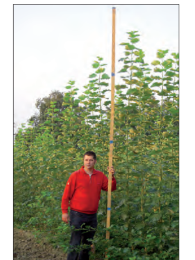
Nahezu vier Meter gewachsen – und das in nur sechs Monaten.

wieder aus. Kurzumtriebsflächen sind rechtlich gesehen nicht Wald sondern landwirtschaftliche Nutzflächen.