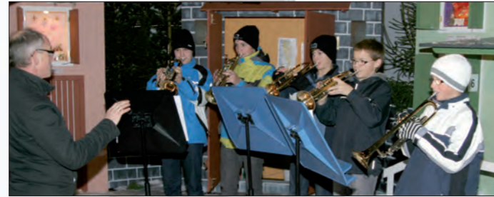
Alle Jahre wieder werden die Besucher des Musischen Adverts in eine einzigartige und besondere vorweihnachtliche Stimmung versetzt.

Besinnliches und einzigartige vorweihnachtliche Stimmung können die Besucher des Musischen Adverts am Haager Hauptplatz genießen: Ein großer Standmarkt, eine umfangreiche Kunsthandwerksausstellung, das beliebte Pfarrcafé und zahlreiche musikalische Veranstaltungen am Hauptplatz und in der Pfarrkirche, die von Haager Schulkindern, Lehrern, Vereinen und musikalischen Gruppen aus der Region durchgeführt werden, machen den Haager Musischen Advent in der Region einzigartig.