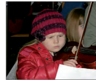
Ganz Haag macht mit.