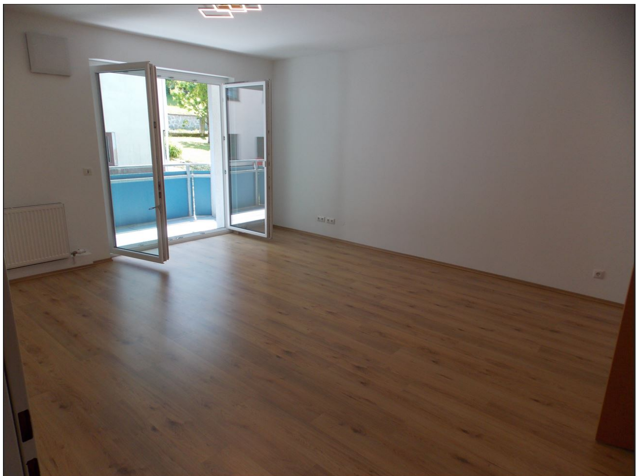
Wohnzimmer mit Aussicht