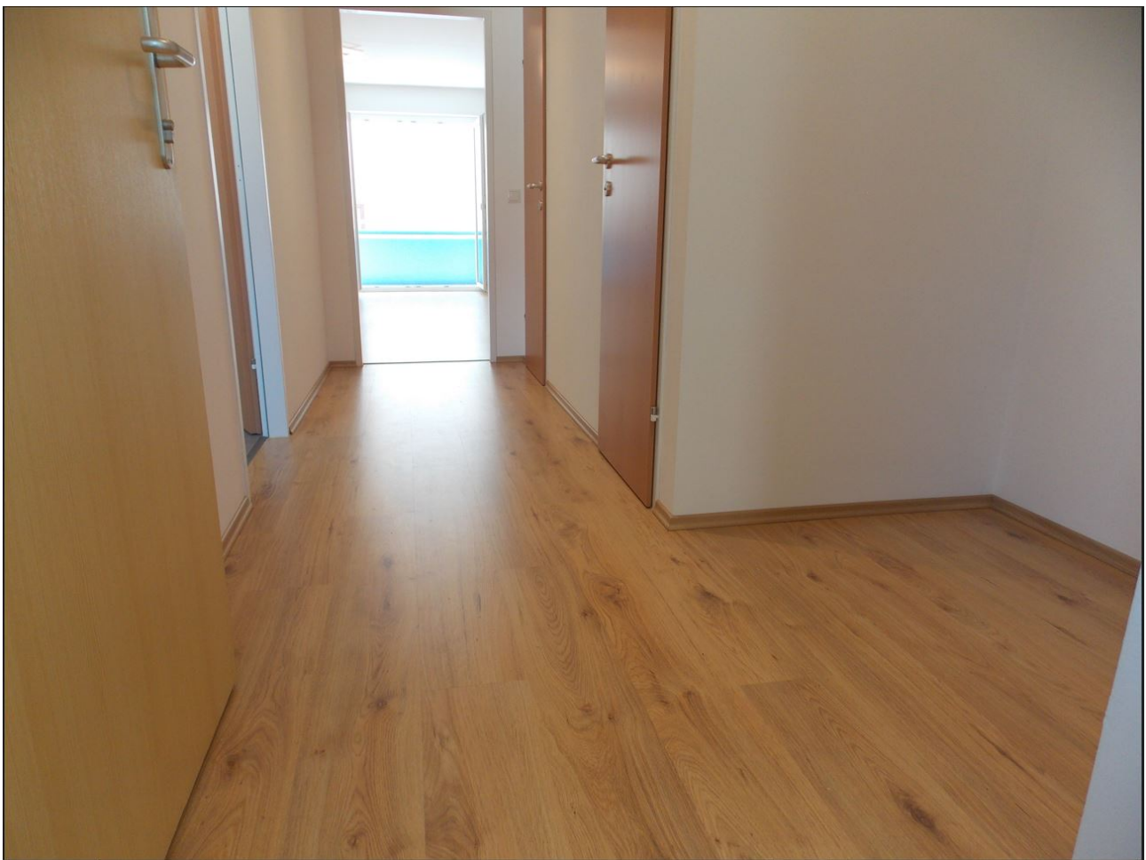
Gang in Richtung Loggia