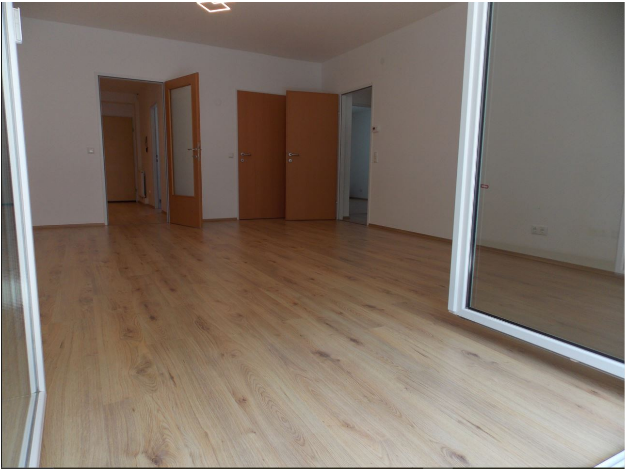
Wohnzimmer Ansicht von Loggia