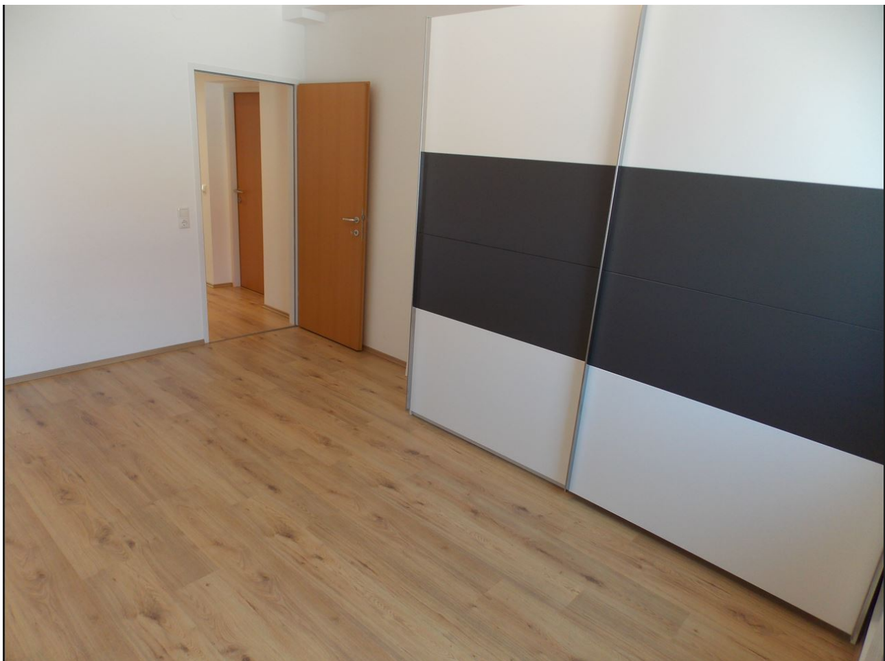
Schlafzimmer mit Kasten